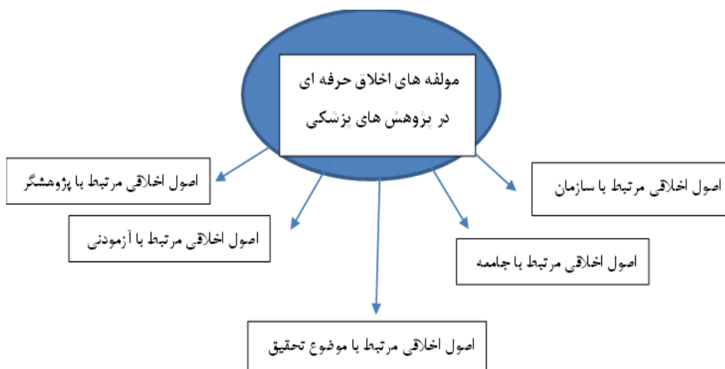
نگاره ۲: مولفه های اخلاق حرفه ای در پژوهش های پزشکی

شاخص های همچنین در بررسی های عمیق و تحلیل یافته های حاصل از شاخص های اخلاق حرفه ای در پژوهش های پزشکی، پنج