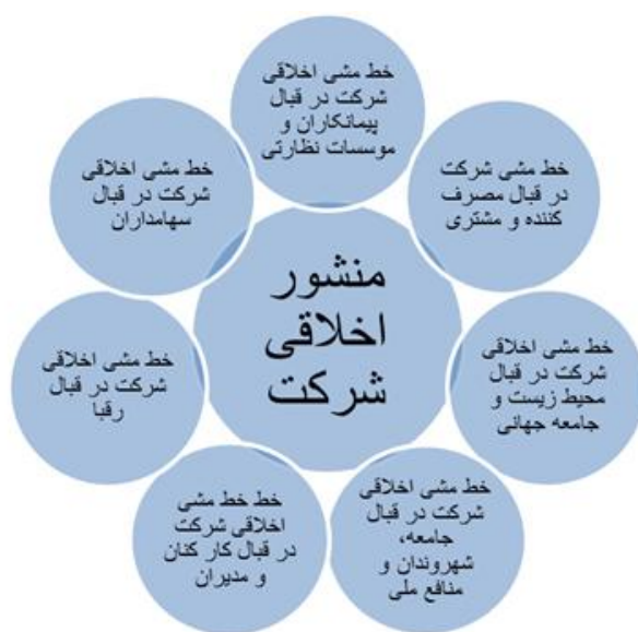
نگاره 1: نمونه منشور 7 وجهی سازمان (8)

منظور ارتقای سطح اخلاق در سازمان، به اثربخشی برنامه‌ها و تأثیر آنان بر سطح اخلاق در سازمان توجه ننموده و می‌توان این دسته از روش‌ها را از نظر روایی زیر سؤال برد (9). مدل قضاوت مصاحبه‌ای نیز هر چند مبنای سایر الگوهای سنجش اخلاق قرار گرفته، لیکن از آنجا که مبتنی بر مصاحبه بوده نیازمند صرف زمان و هزینه بالایی می‌باشد. آزمون تعریف موضوعات بحث‌انگیز نیز محدود به سنجش رفتار و اخلاق فردی بوده و در مطالعات سازمانی و گروهی از کاربرد پایینی برخوردار می‌باشد (10).